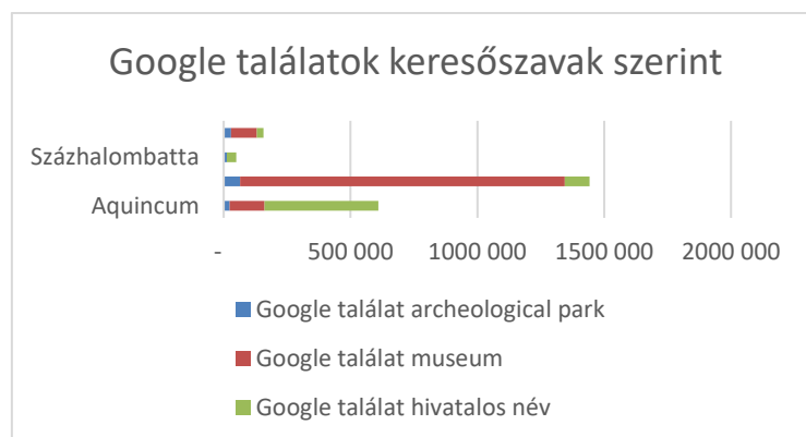
4. ábra: Google találati lista keresőszavak alapján

Ezek a megállapítások a keresőoptimalizálás szempontjából mindenképpen fontos információkat jelentenek, hiszen a megfelelő beállításokkal jelentősen növelhető a régészeti parkok online elérése.