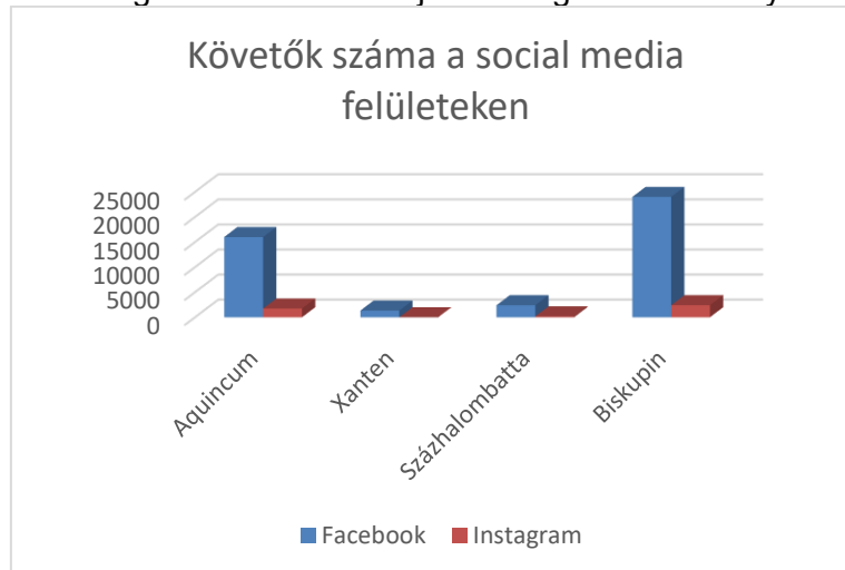
3. ábra: Social media követőinek száma

Kutatásunkban sor került a vizsgált régészeti parkok social media jelenlétének, mint az online tér egyik legfontosabb platformjának vizsgálatára is. Ezek között alapvetően a Facebook dominál, ezen mindegyik régészeti park rendelkezik saját fiókkal. Érdekes módon e tekintetben Biskupin kiugróan magas követőbázissal rendelkezik, őt követi Aquincum nyolcezerrel kevesebb követővel, a legkevesebb pedig Xanten rendelkezik. Az Instagram használata már közel sem annyira jelentős, Xanten nem is rendelkezik felülettel ezen az oldalon, ahogy a 4. számú ábra mutatja. A többi régészeti park jelenléte sem erős, Biskupin és Aquincum követőszáma ezen a felületen közel azonos, Százhalombatta követőinek száma pedig a 200-at sem érte el a vizsgált időszakban. A többi social media felületet többségében nem használják a vizsgált létesítmények.