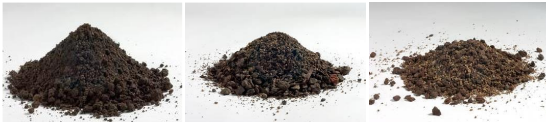
2. ábra. K1 szubsztrát