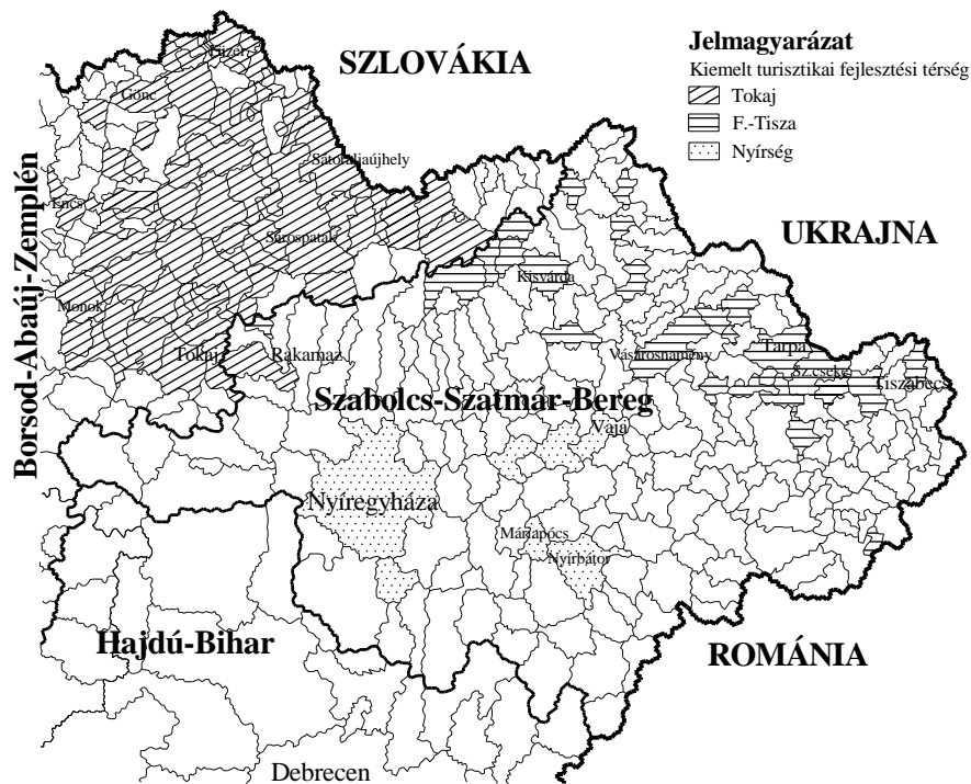
1. Ábra. Tokaj, Felső-Tisza és Nyírség kiemelt turisztikai fejlesztési térség települései

A 2017. február 21-én megjelent 1092/2017 számú Kormányhatározat a 105 településből álló Tokaj, Felső-Tisza és Nyírség kiemelt turisztikai fejlesztési térséget határozta meg, amely 3 nagyobb egységből áll. [5] (1. Ábra)