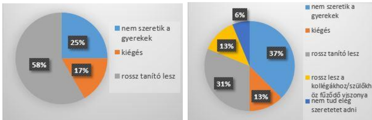
5-6. ábra A tanítóként elkerülendő kudarc a nem partnerségi és partnerségi képzésben résztvevők szerint (2019)

A pályakép tekintetében végül a tanítói pályához kapcsolódó kudarcról alkotott elképzeléseket vizsgáljuk meg. A pályaválasztás során is fontos szempont lehet, hogy egy-egy szakma esetében mi az, ami veszélyként fogalmazódhat meg, és annak elkerülésére vagy elhárítására az egyén milyen megoldásokat lát, illetve tudja-e hogyan kérhet adott esetben segítséget. Mindezen szempontok közül most azt mutatjuk be, hogy az első éves tanító szakos hallgatók mit szeretnének elkerülni, ha tanítóként dolgoznak, mi az, ami számukra kudarc lenne? (lásd 5. és 6. ábra)