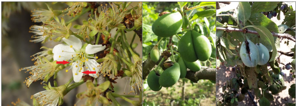
2. ábra. Két termővel rendelkező virág (balra), ikergyümölcs és beforradás különböző stádiumokban (középen és jobbra) (Kecskemét, 2019)

A harmadik felvételezés (2019.07.19.) során szintén e három kategória alapján dolgoztunk.