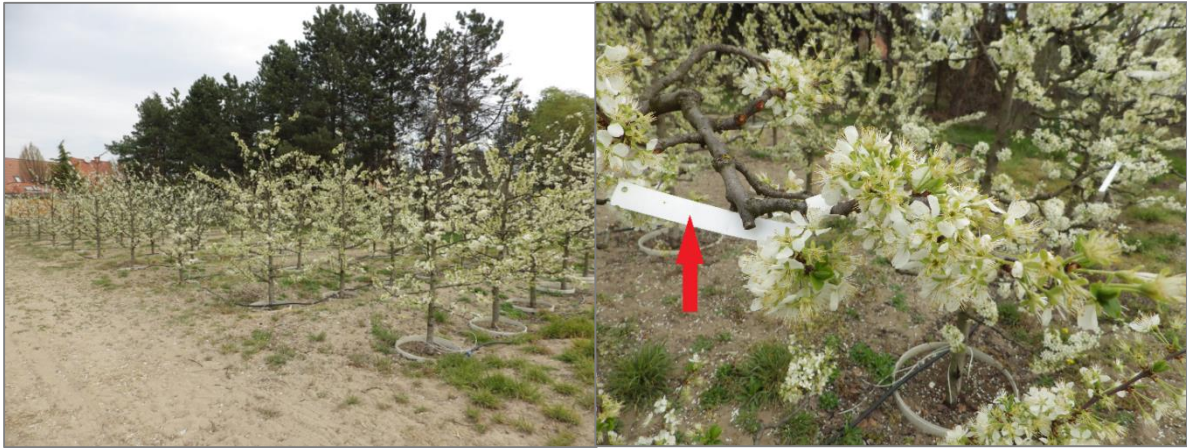
1. ábra. A kísérlet helyszíne és a kijelölés módja (Kecskemét, 2019)

A virágzás kezdetét várva, több alkalommal is ellenőriztük, hogy elindult-e már a szirmok kiterülése. A virágzás kezdete 2019. március 29-én volt, amikor a virágok körülbelül 5% már kinyílt. A jó idő miatt a teljes virágzás április 1-én kezdődött. A virágok vizsgálatát ekkor végeztük, mivel ilyenkor kaphatunk pontos képet, amikor már minden virág kinyílt, de még nem kezdődött meg a szirmok hullása, mert az kissé nehezítheti a virágok megkülönböztetését, az esetleges sűrű virágszám esetén. Előfordult azonban, hogy néhány virág bimbóban volt még, viszont nem várhattunk a kinyílására, mert addigra a többi elvirágzott volna. Azért, hogy ez ne befolyásolja az eredményeket, számolás közben ezeket eltávolítottuk. Ezen körülményeket figyelembe véve a virágokat 2019. április 4-én számoltuk meg.