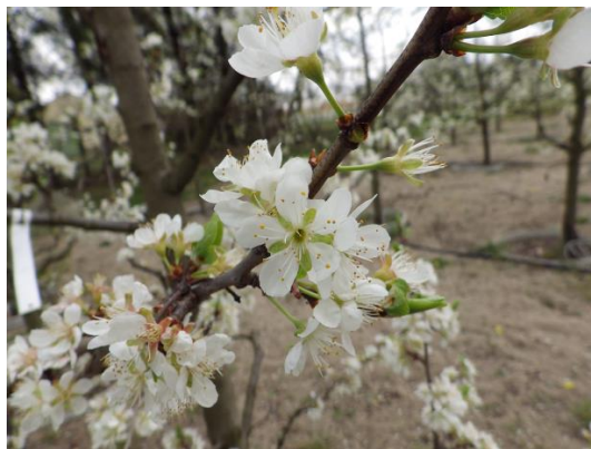
5. ábra. 'Jojo' termő nélküli virága (Kecskemét, 2019)