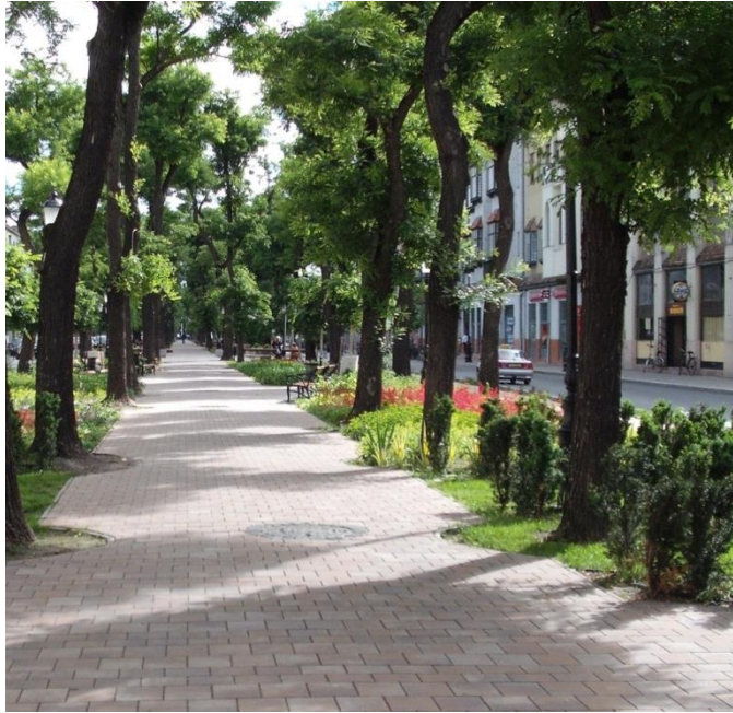
4. ábra Árnyas sétány és virágágyak a Rákóczi úton (2014)

A feldolgozott minták száma nem magas, de a megfelelő módszerek megválasztása alapján a következtetések helytállóak. A munkánk jó alapot adhat további kutatások megalapozásához.