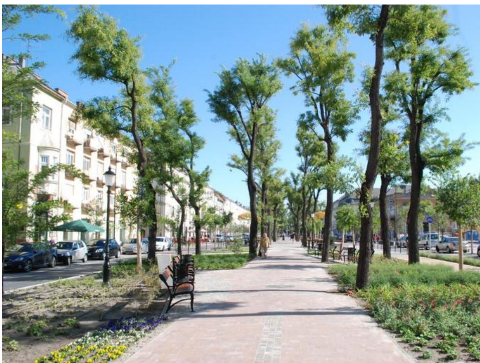
2. ábra. Ifjított idős fák (Sophora japonica) a Rákóczi úton 2012

A zöldterület növényeire két kérdés vonatkozott. A rekonstrukció előtt a területen japán akác (Sophora japonica) fasor volt. Erre vonatkozó állításunk: jó hogy az idős fákat megőrizték , melyeket szemléltet az 1. ábra.