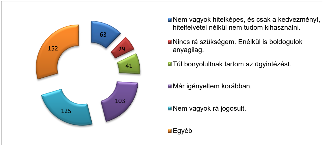
2. ábra: Amennyiben nem igényelte, de jogosult lenne rá, miért nem? N=513 háztartás

A törvényben előírt feltételek teljesítése érdekében, a háztartások igen nagy hányada jelzáloghitellel és egyéb hitellel egészítené ki a támogatásból kapott összeget, ingatlancéljaik megvalósítása érdekében. Tehát a családok jelenlegi anyagi helyzete nem minden esetben teszi lehetővé a kizárólag önerőből és az állami támogatásból történő finanszírozást. Szükségük lenne hitelek felvételére is. Az elmúlt időszak hitelezési és hitelfelvételi szokásaira, a devizahitelek máig véget nem érő problémáira is emlékezve sok esetben a Családok Otthonteremtési Kedvezményére jogosult háztartások nagy része nem tekinthető hitelképesnek, amely megakadályozza őket a CSOK adta lehetőség érvényesítésében. Jelen kutatásunkban a válaszadók több, mint 12 százalékát érinti ez (63 háztartás). Elég magas azok száma is (8 százalék), akik túl bonyolultnak tartják, ami elriassza őket annak igénybevételétől. Itt ez egyértelműen a pénzügyi ismeretek hiányára vezethető vissza. 24 százalék nem jogosult rá, 30 százalék pedig egyéb okot jelölt meg. Csupán 29 háztartás, (5,6 százalék) nem igényli mivel anyagilag nincs rászorulva.